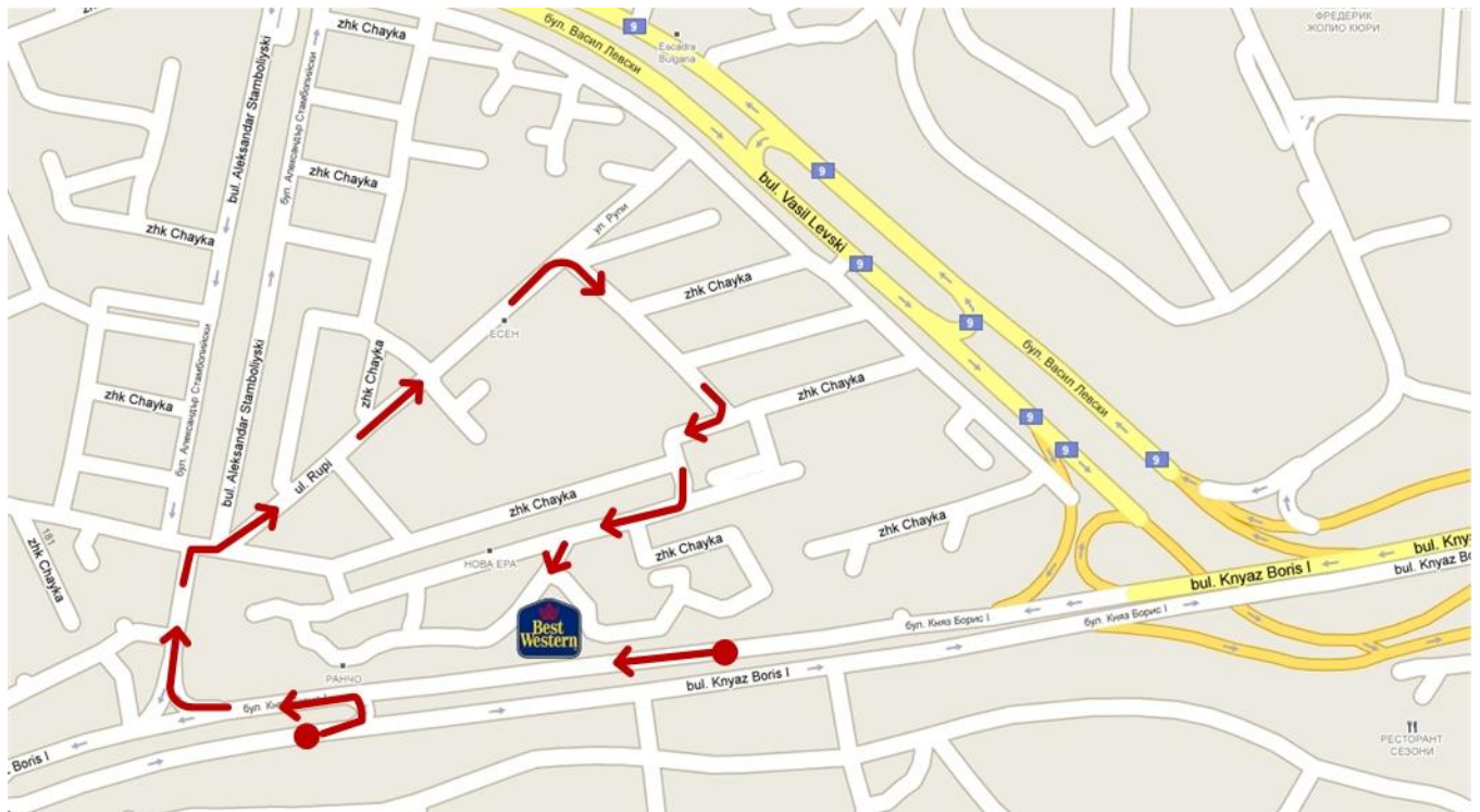
Карта на района около хотела с малките улици до входа на хотела